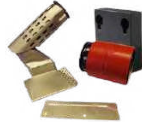
Kit Bitume pour LARON