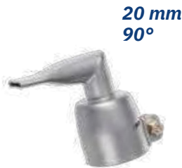
20 mm 90°