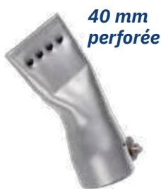
40 mm perforée