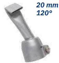
20 mm 120°