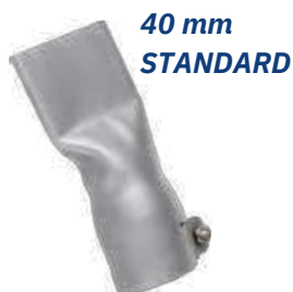
40 mm STANDARD