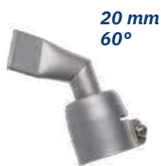
20 mm 60°