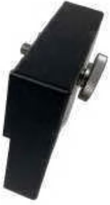
Poids additionnel pour MULTI