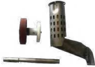
Kit profiles pour LARON