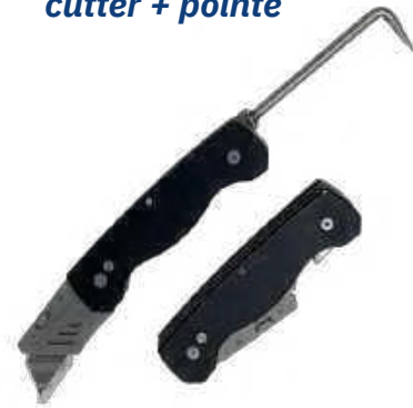
cutter + pointe