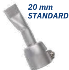
20 mm STANDARD

(et l'ensemble des marques d'appareils du marché)