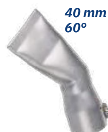
40 mm 60°